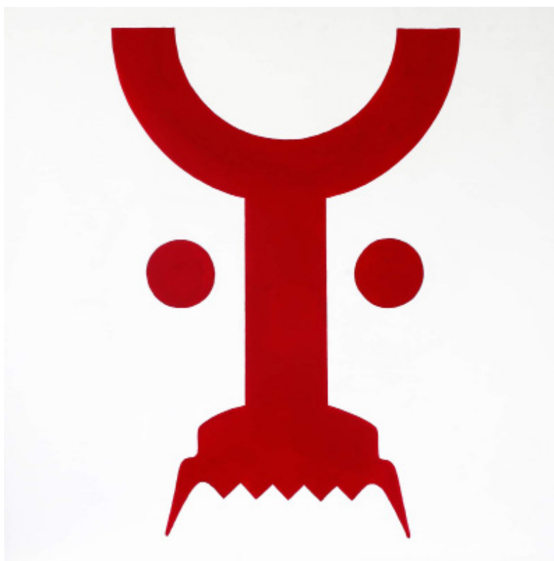
Heberth Sobral. Ação, I.P.O. 2, 2022. Acrílica sobre madeira. 42 x 42cm.

abertura 31 mar exposição 1 abr — 21 mai 2022